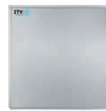
SUPER STAR PLUS MDP150