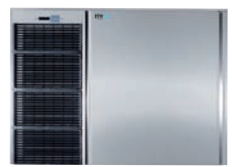
SUPER STAR PLUS MR400